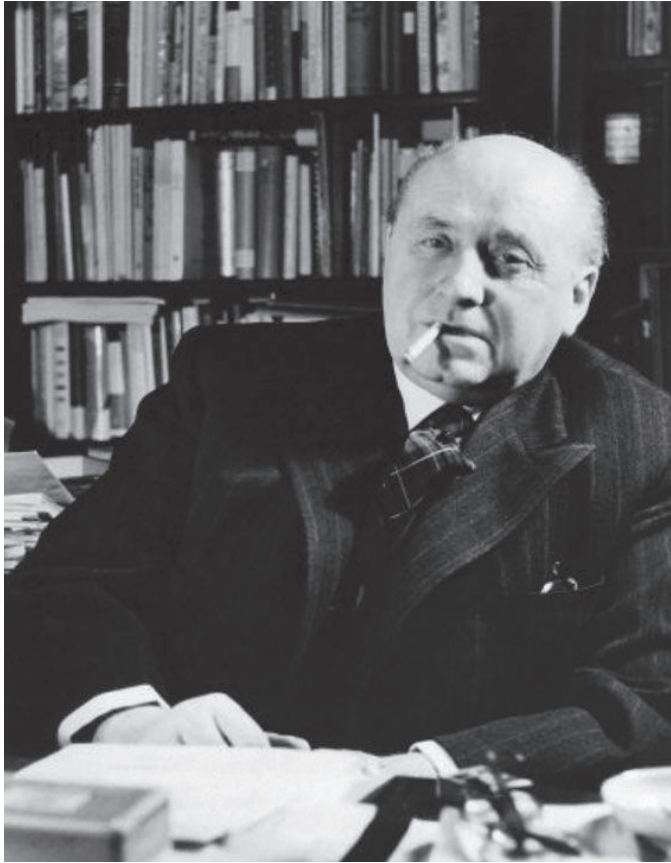
Slika 2. Gottfried Benn u svojoj radnoj sobi u studenom 1955. godine

pokazuje da su prve godine rata za Benna bile iznimno teške: s jedne strane zbog toga što je kao liječnik na bojišnici neposredno gledao sve ratne strahote, s druge strane zbog zabrane književnog djelovanja. Kada se vratio s rehabilitacije, Wehrmacht je već bio napao Sovjetski Savez. Tijekom 1941. i 1944. godine Bennov garnizon biva više puta premještan u Landsberg/Warthe, gdje je Benn ukupno proveo 17 mjeseci. Jednako kao za vrijeme boravka u Hannoveru, Benn osjeća tjeskobu provincije, ali unatoč tome u Landsbergu nastaju neka od njegovih kasnije značajnih djela. Zbog povlačenja njemačke vojske pred Crvenom armijom Benn 1945. napušta Landsberg i vraća se u Berlin, gdje će voljeni grad zateći u kaosu i ruševinama.