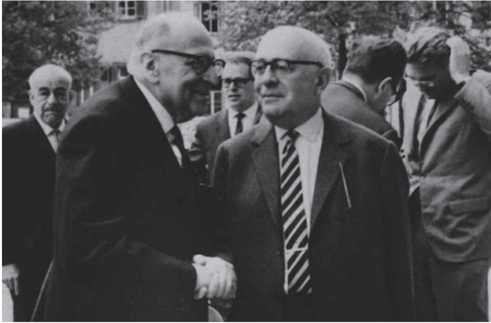
Slika 1. Theodor Adorno (desno) i Max Horkheimer (lijevo) 1965. godine u Heidelbergu

budući da se paralelno s njihovom ustrajnom strategijom pisanja o problemima liberalizma, prosvjetiteljstva i dominantne filozofske i kulturne matrice poslijeratnog vremena, problem vlastitog pozicioniranja unutar kulturne paradigme još uvijek nalazi kao etički imperativ u središtu njihova intelektualnog djelovanja. Jednostavnije rečeno, prokazivati probleme prosvjetiteljstva, čija je totalitarna logika ovladavanja čovjeka nad prirodom dovela do potpune besubjektivacije subjekata (Adorno), naposljetku nije ništa drugo nego još jedan prosvjetiteljski manevar višega reda. Ili, u Krležinu slučaju, na poznatom primjeru iz eseja o Erazmu Roterdamskom, osuđivati „klerikalnobanalnu, kurijalnoučtivu, pretvorljivu i potpuno negativnu” 10 recenziju povodom mađarskog prijevoda Erazmove Pohvale gluposti ne jamči nužno biti izuzet od zahtjeva koji se pred Krležu postavlja, a to je, sažeto rečeno, odgovoriti na zahtjev koji si i sam Krleža postavlja: kako biti Erazmo danas? Stoga se pozicija s koje progovaraju i Adorno i Krleža neovisno o sadržaju i smjeru kritika kojima raskrinkavaju kulturnu industriju pokazuje izuzetno važnom jer ona dosljednost kojom se pristupa problemu kritike mišljenja svoj prvi test ima upravo u manifestaciji njihove vlastite pozicije intelektualca u poslijeratnom vremenu.