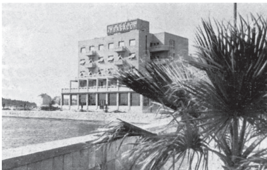
Sl. 6. Hotel „Ambasador“ na zapadnom kraju Rive. Projekt arh. Josipa Kodla.

U gradu je nedostajalo hotela koji bi komforom zadovoljavali zahtjevnije, posebno strane goste. Postojeći su uglavnom bili starije zgrade preuređene za ugostiteljstvo. Premda su se vlasnici trudili da ih uredi, rezultati su bili skromni. Ipak je dosta toga učinjeno. Osim već spomenute obnove hotela „Bellevue“, preuređeni su i hoteli „Central“, „Sava“ i „Slavija“ te još nekoliko manjih.