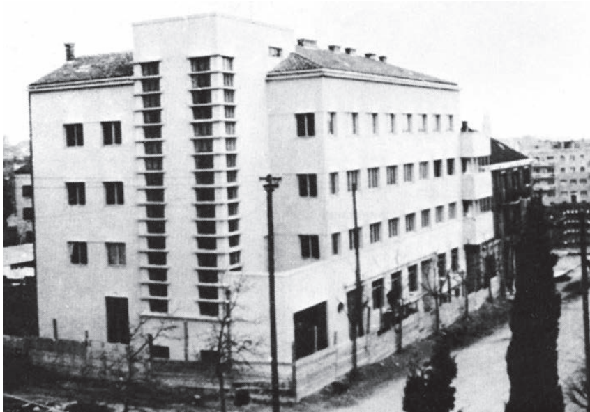
Sl. 5. Burza rada u Zrinsko-frankopanskoj ulici. Projekt arhitekata Helena Baldasara i Emila Cicilijanija.

U državi, pa i u Splitu, bio je velik broj nezaposlenih radnika. Skrb za njih povjerena je posebnom uredbom iz 1927. Središnjoj upravi rada i njezinim Javnim berzama rada. 23 Zadatak im je bio posredovati u radnim odnosima. U to vrijeme otvoren je i ured u Splitu. Trebalo je osigurati podizanje zgrade za njegov smještaj te za smještaj Radničkog azila