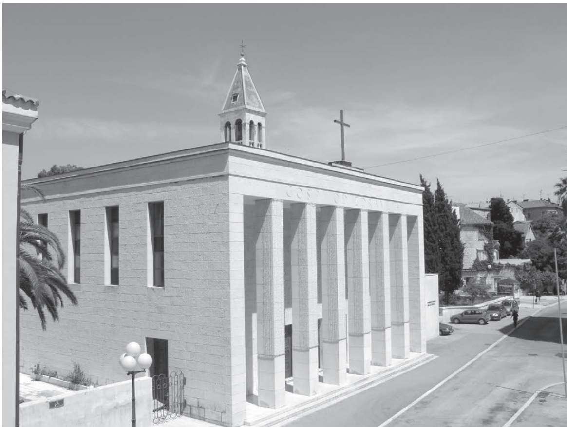
Sl. 8. Crkva Gospe od zdravlja na Manušu. Projekt arh. Lavoslava Horvata.

Škrivanić založio za nadogradnju drugog kata. Nacrt je besplatno napravio arh. Lavoslav Horvat, ali je izbila gospodarska kriza pa su banke zaustavile kreditiranje. Konačno se 1938. odlučilo ostvariti stari projekt. Preradio ga je arh. Fabjan Kaliterna. Siromašni redovnici nisu imali sredstava pa su se za gradnju prikupljala sredstva od građana. Radovi su završeni 1939. godine, na 30. godišnjicu preuzimanja svetišta. 39