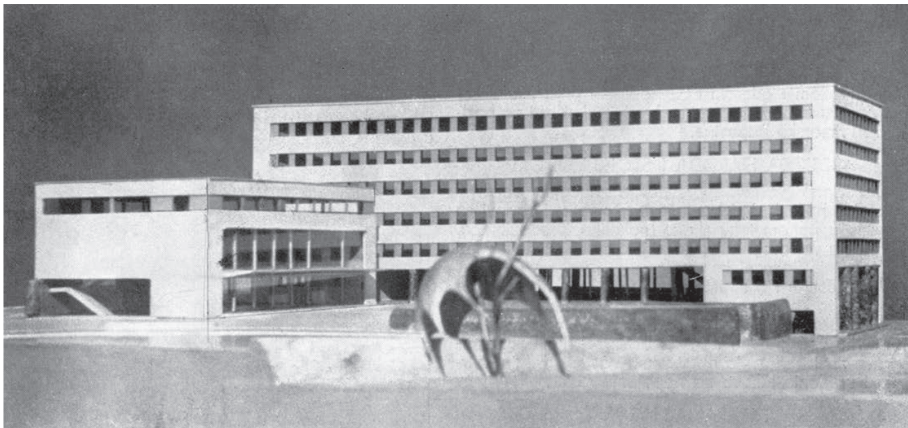
Sl. 2. Palača Primorske banovine na zapadnoj obali. Projekt zagrebačkih arhitekata Nikole Despota, Vida Vrbančića i Vladimira Turine.

Slijedila je 1933. zgrada Penzionog zavoda u Hrvojevoj ulici autora arh. Vladimira Šubica iz Ljubljane i 1935. palača Burze rada u Zrinsko-frankopanskoj ulici, koju je projektirao arh. Helen Baldasar. Konačno je 1939. sagrađena Bratimska blagajna na Bačvicama po projektu Emila Cicilijanija. 13