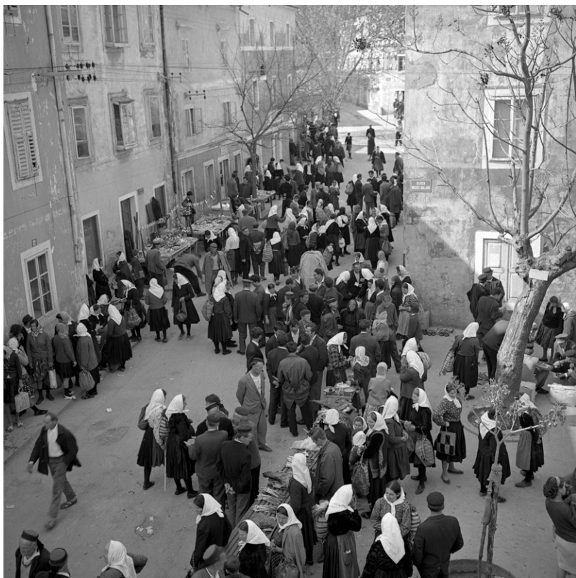
Sajmeni dan u Obrovcu 1966.

(Narodni muzej Zadar – Galerije umjetnina, Zbirka A. Brkan, br. 13271)