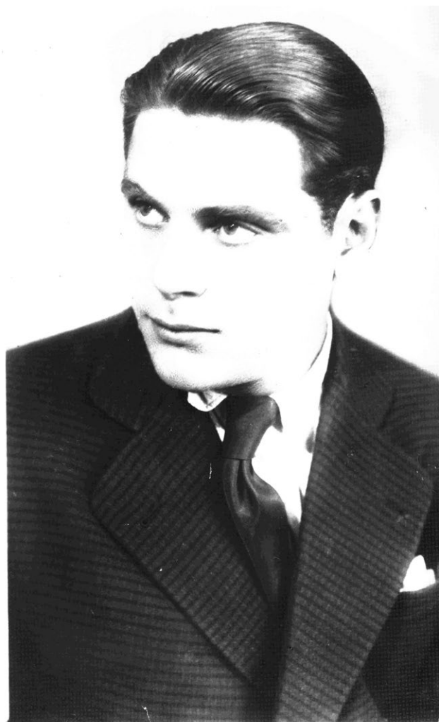
Vladan Desnica 1932.