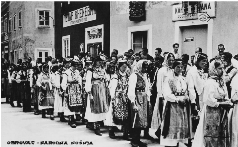
Smotra folkloru u Obrovcu (b. d.)