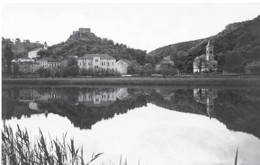
Obrovac koncem 19. stoljeća (Zbirka Matice Obrovčana)