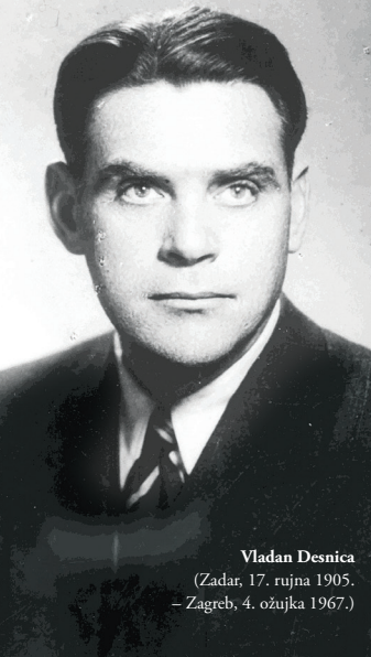
Vladan Desnica (Zadar, 17. rujna 1905. – Zagreb, 4. ožujka 1967.)