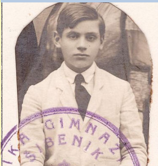
Vladan Desnica, učenik šibenske gimnazije 1921./1922. – 1923./1924.

Na „Desničini susretima 2013.“ uvedeno je nekoliko programskih inovacija, uključujući i izložbu posvećenu Vladanu Desnici, održanu u Gradskoj knjižnici Zadar od 18. do 28. rujna 2013. Izložbu su činile četiri cjeline: 1) Zadrani Vladan Desnica; 2) Islamljanin Vladan Desnica; 3) Kula Jankovića u Islamu Grčkom: vitalnost baštine i 4) „Desničini susreti“: jučer, danas i sutra ( Panoi 9 – 16 ).