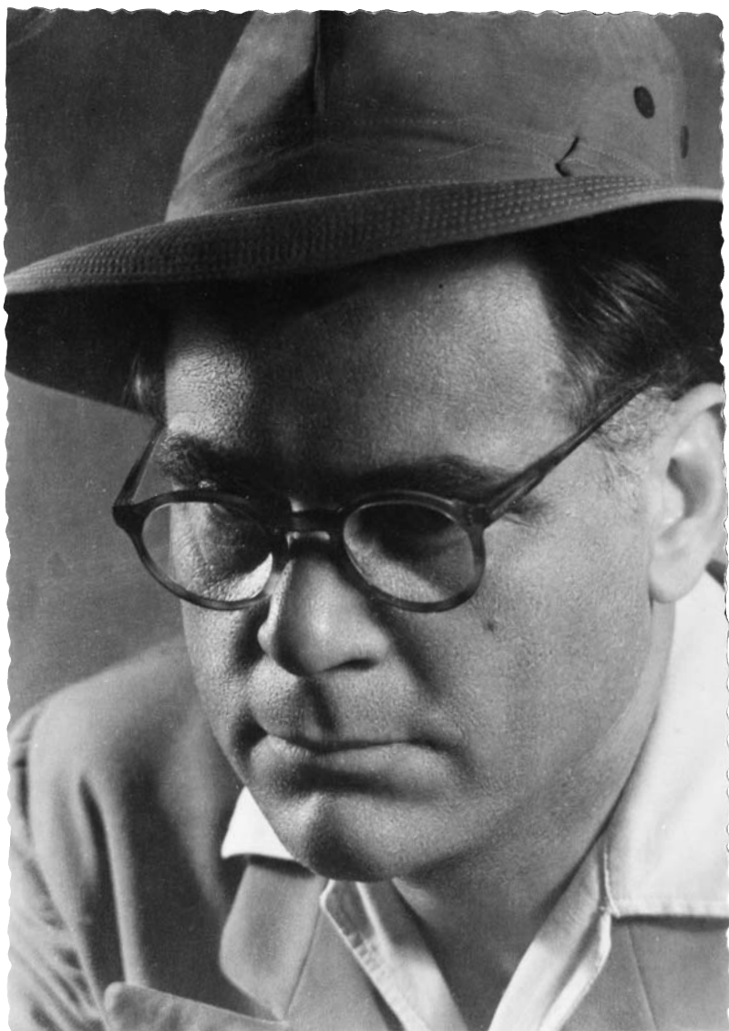
Vladan Desnica (Zadar, 17. rujna 1905. – Zagreb, 4. ožujka 1967.)