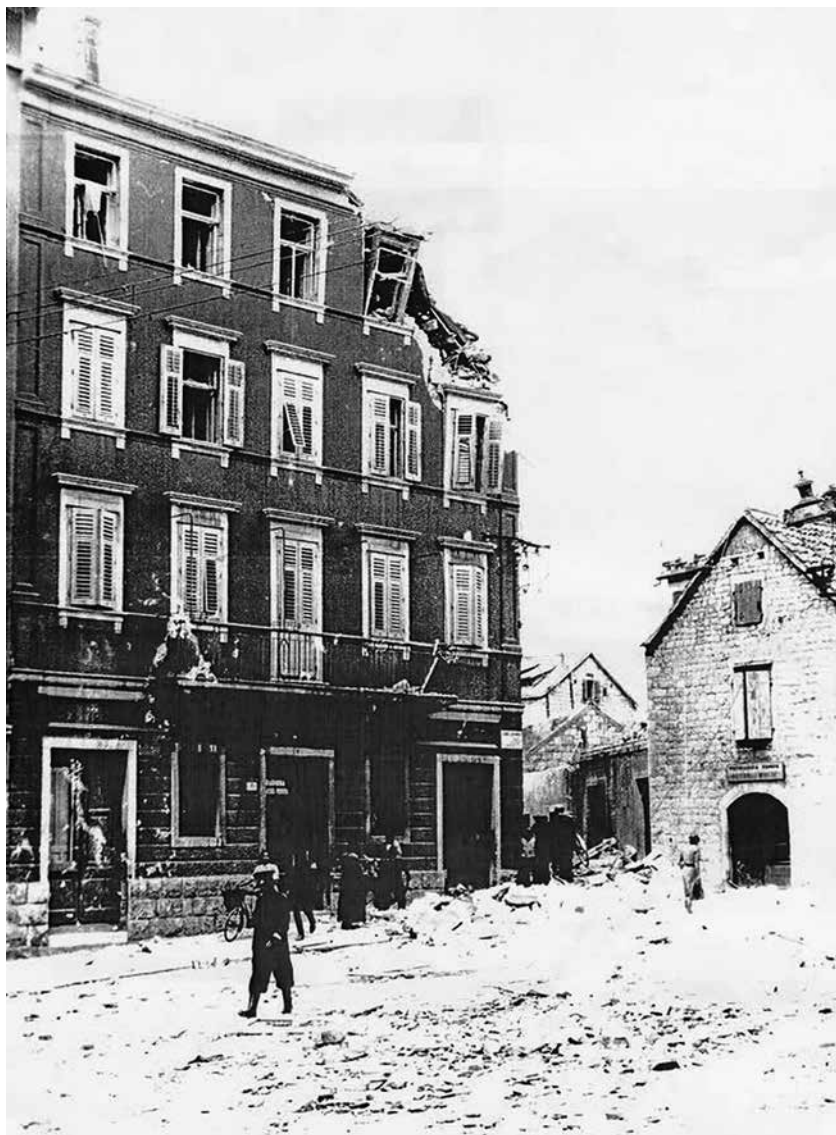
Kuća obitelji Desnica na Tomića Stinama 1 snimljena nakon savezničkog bombardiranja Splita 3. lipnja 1944. godine.